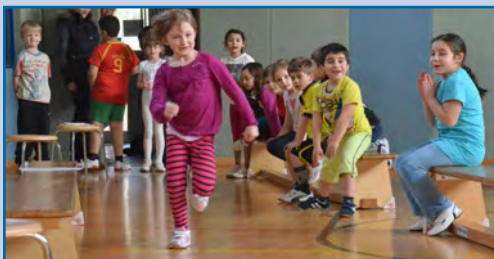
Gesund groß werden: Gesunde Kinder in gesunden Kommunen mit der eads.

novative Impulse für die deutsch-niederländische Grenzregion und für die europäische Integrationsarbeit aus. Dies gilt es weiter zu stärken und auszubauen.