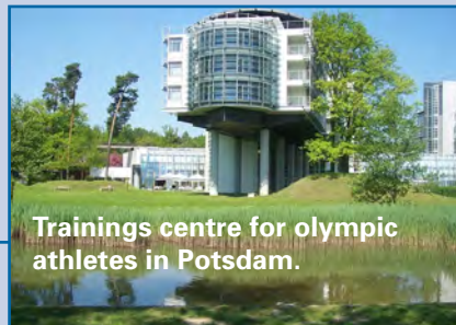
Trainings centre for olympic athletes in Potsdam.