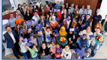
Award of Europe 2016.