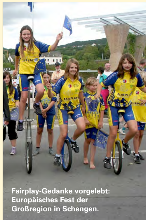
Fairplay-Gedanke vorgelebt: Europäisches Fest der Großregion in Schengen.

MARTIN SCHULZ, Präsident des Europäischen Parlamentes