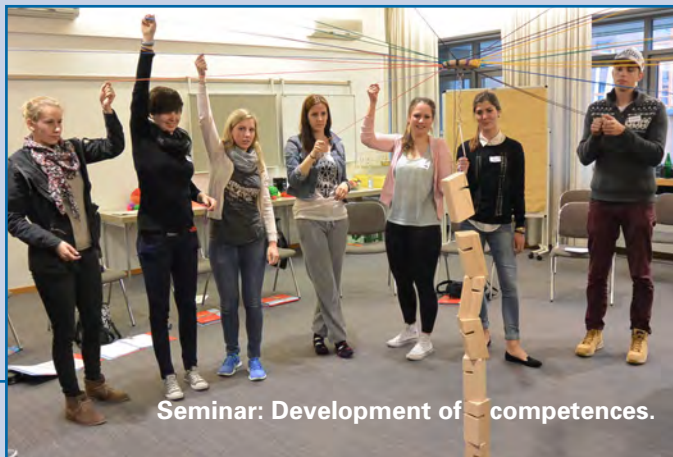
Seminar: Development of competences.