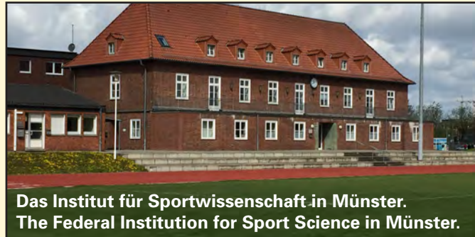
Das Institut für Sportwissenschaft in Münster. The Federal Institution for Sport Science in Münster.

Gegenwärtig werden Auftragsarbeiten für das Bundesministerium für Bildung und Forschung (BMBF), die Deutsche Sportjugend (dsj) und die EU-Kommissi-