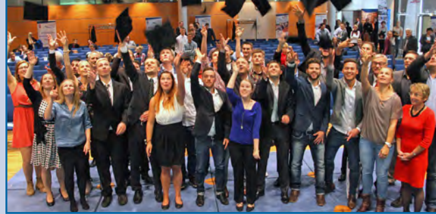
Graduates 2015 of the college for sports and management.

members out of Brandenburg, Germany, Poland and Sweden.