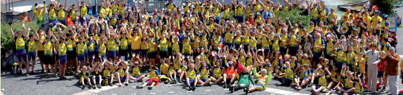
Jährliche Fair-Play-Tour mit jungen Radfahrern in der Großregion in Rheinland-Pfalz, Luxemburg und Frankreich. Fair-Play-Tour with young cyclists in the area of Rheinland-Pfalz, Luxemburg and France.