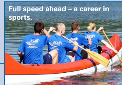
Full speed ahead – a career in sports.