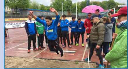
Sports insignia with refugees.