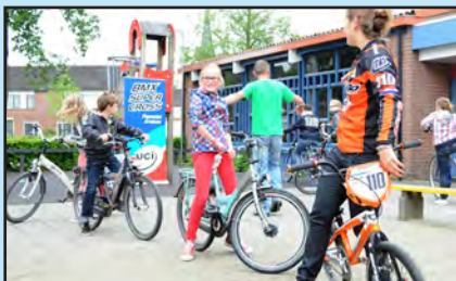
Sport en bewegen met het GSF.