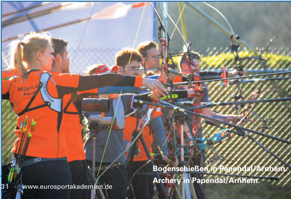
Bogenschießen in Papendal/Arnhem. Archery in Papendal/Arnhem.

The HAN-academy offers almost every kind of professional academic education within the following areas of study: sport and motion, education, social system, trade, communication, management of companies, economy, technology, building industry, applied sciences, informatics and communication, healthcare, nursing. In these areas students can choose between more than 65 bachelor-, eight Associate degree- and 21 master courses.