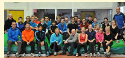
Deutsche und niederländische Athleten, vereint in Rhede bei Bocholt. German and Dutch athletes, unite in Rhede – close to Bocholt.