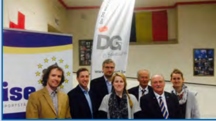
ISE-stand in Eupen, Belgium.