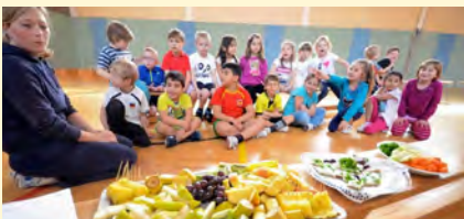
Projekt „Gesunde Kinder in gesunden Kommunen“: Schul-Frühstück. “Healthy children in healthy communities“: breakfast in schools.