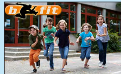
Het programma b-fit.

Betrokken --wij hechten veel waarde aan een positieve sfeer en een warme omgang met elkaar.