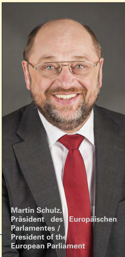
Martin Schulz, Präsident des Europäischen Parlamentes / President of the European Parliament

Sport kann soziale Unterschiede überbrücken. Menschen mit Behinderung können ihre Fähigkeiten unter Beweis stellen, und auch die