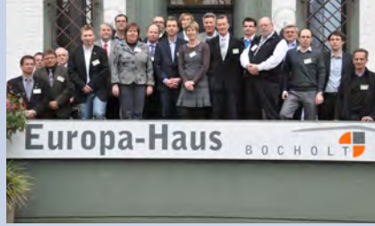
Seminar participant in Europahaus.