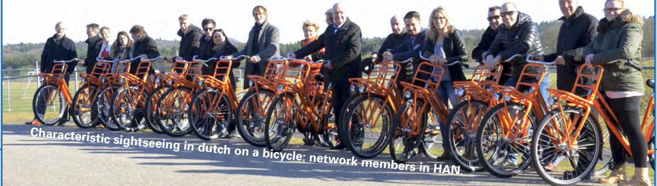
Characteristic sightseeing in dutch on a bicycle: network members in HAN