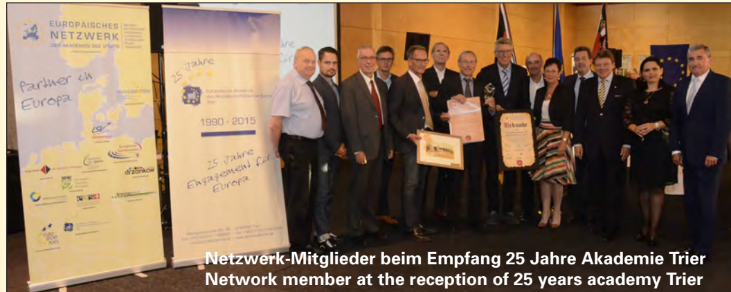
Netzwerk-Mitglieder beim Empfang 25 Jahre Akademie Trier Network member at the reception of 25 years academy Trier