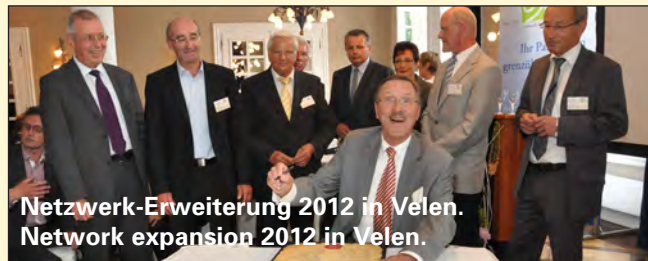
Netzwerk-Erweiterung 2012 in Velen. Network expansion 2012 in Velen.