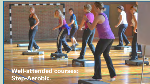
Well-attended courses: Step-Aerobic.