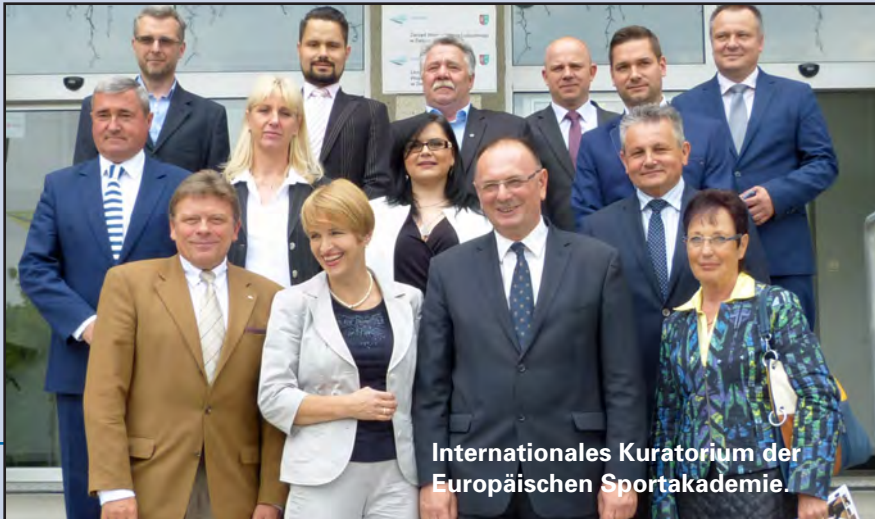
Internationales Kuratorium der Europäischen Sportakademie.