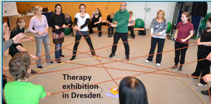
Therapy exhibition in Dresden.

Furthermore, the Educational Institution is co-organiser of further education, f.x. with the border crossing sports academy of Drzonków, the Transgraniczna Akademia Sportu (TAS) WOSiR Drzonków (Poland).