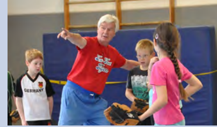
Strengthen children with motion.