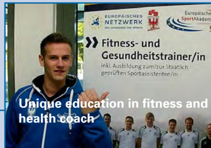
Unique education in fitness and health coach

ESAB's main goal is to offer innovative education and forward-looking services.