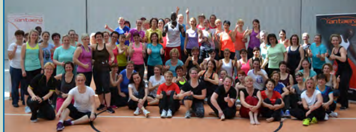
Gesund bleiben mit Sport: großer Erfolg in Dresden. Stay healthy with sport: huge success in Dresden.

Das Bildungswerk ist seit 1996 Ausbildungsstützpunkt für den Bundesverband der deutschen Rückenschulen (BdR), veranstaltet seit 2006 die Sächsische Gesundheitssportakademie, seit 2009 Lehrerfortbildungen im Auftrag des sächsischen Kultusministeriums und ist Mitorganisator von Fortbildungen, so mit der Grenzüberschreitenden Akademie des Sports Drzonków, der Transgraniczna Akademia Sportu (TAS) WOSiR Drzonków (Polen).