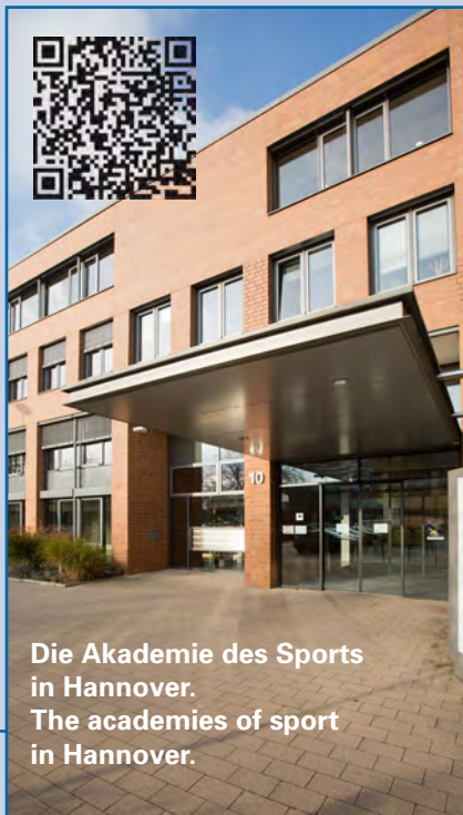
Die Akademie des Sports in Hannover. The academies of sport in Hannover.

mit unterschiedlichen Werten und Perspektiven. Sie gibt Impulse für die Auseinandersetzung mit gesellschaftlichen Entwicklungen und bringt kreative Ideen aus Sicht des Sports ein.