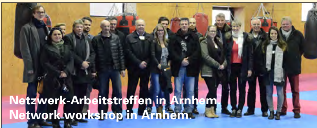
Netzwerk-Arbeitstreffen in Arnhem Network workshop in Arnhem.