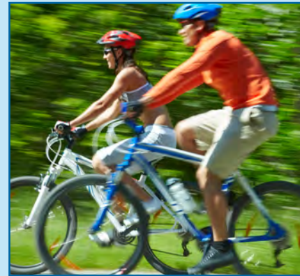
Active on tour with bikes.