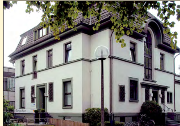
Europa-Haus Bocholt: Servicestelle. Coordination- and service point: European Network of Academies of Sport.