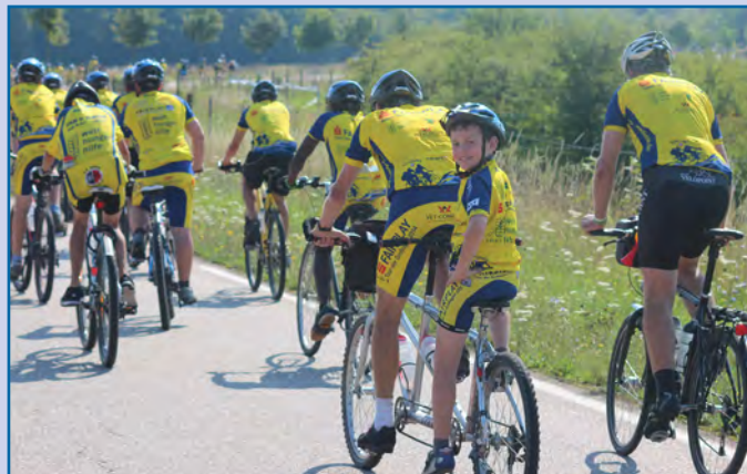
A highlight every year: the Fair-Play-Tour.

Landessportbund Rheinland-Pfalz Ministerium des Innern und für Sport, Rheinland-Pfalz; Europäische Akademie des Rheinland-Pfälzischen Sports, Trier;