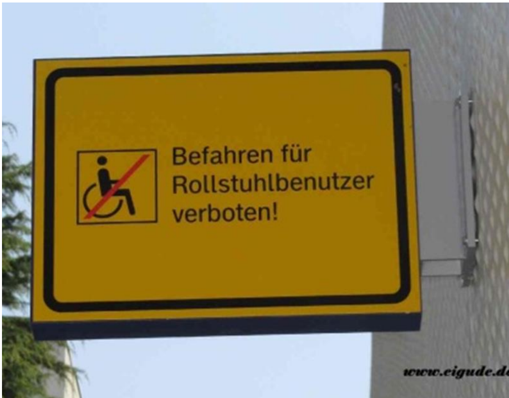
Bild aus Stadt Frankfurt Rampe vor einer Sporthalle